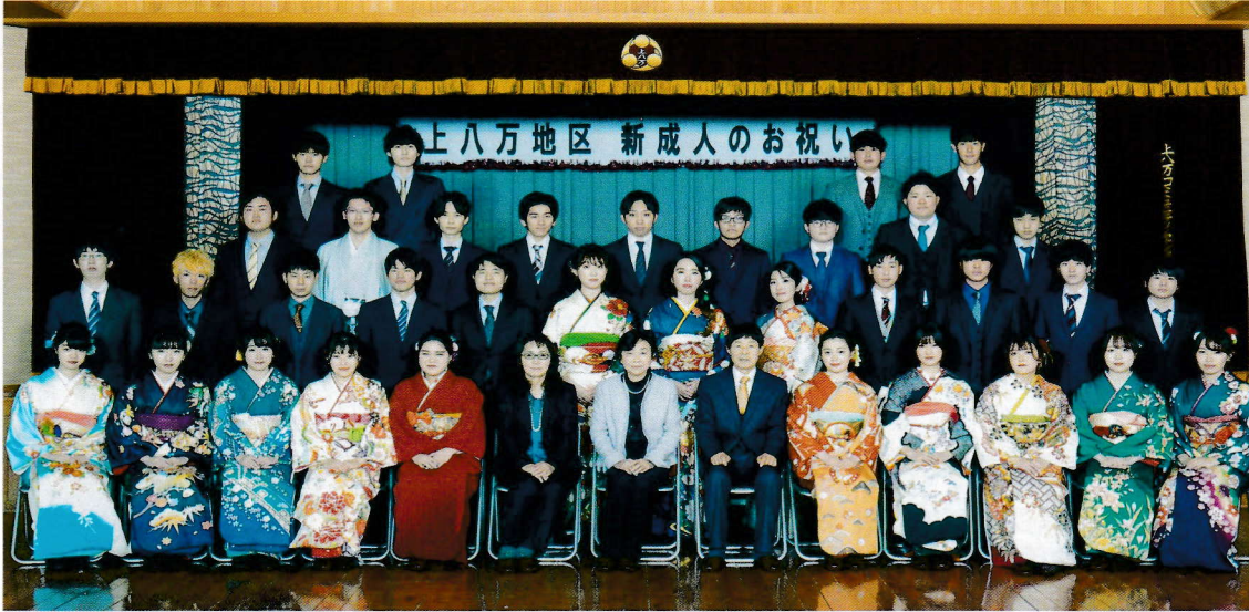
令和3年 上八万地区新成人のお祝い 2021年1月10日